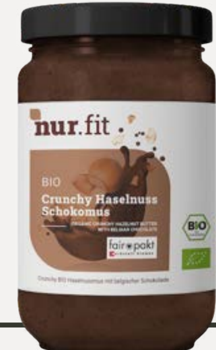
BIO CRUNCHY HASELNUSS SCHOKOMUS

Cremiges Mus aus 100 % BIO Sonnenblumenkernen. Ganz ohne Zusätze.