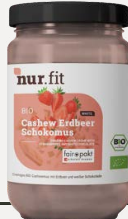
BIO CASHEW ERDBEER SCHOKOMUS

Cremiges Mus aus Haselnüssen und Kokosnussmilch, kombiniert mit veganer belgischer Schokolade.