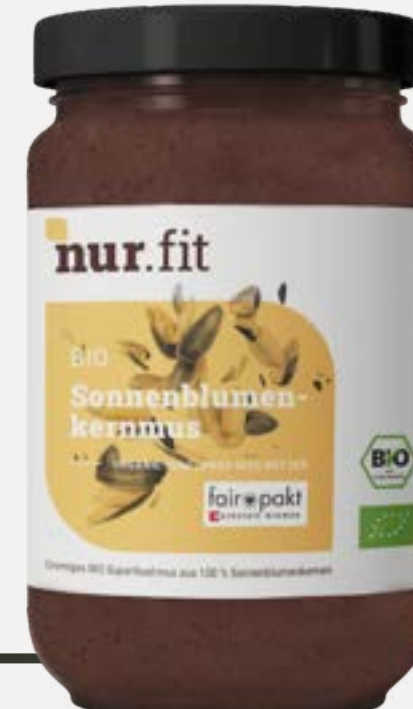
BIO SONNENBLUMENKERN -MUS

Cremiges Mus aus Cashewkernen, kombiniert mit gefriergetrockneten Erdbeeren und veganer weißer Schokolade.