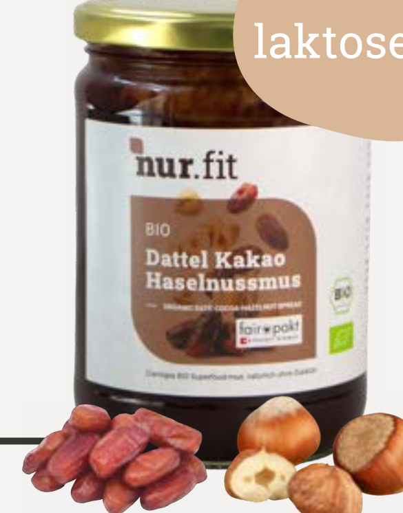
BIO DATTEL- HASELNUSS-KAKAO CREME

Cremiges Mus aus 100 % BIO Haselnüssen. Ganz ohne Zusätze.