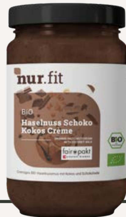
BIO HASELNUSS SCHOKO KOKOS CREMÉ

BIO NUSSMUSE - 100 % NATÜRLICH - 0 % ZUSÄTZE - 100 % VEGAN